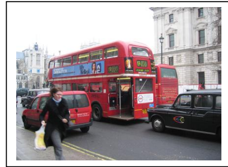
今はなきオールドロードマスターバス