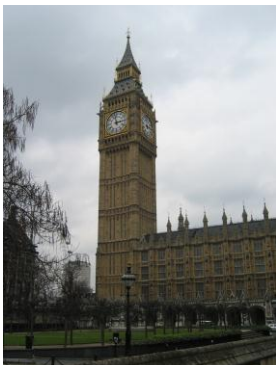
英国議会の時計塔 ビッグベン

もし、議員が省庁に問い合わせがあれば、基本的に、それぞれの省庁の大臣に議場で口頭質問するか手紙を書くのが通例となっています。