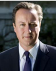
写真：デービッド・キャメロン英国首相